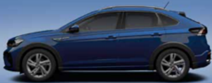
Reef Blue | T Metalliclack