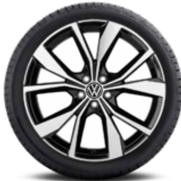
Misano 18" | T