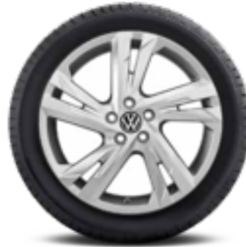
Valencia 17" | S