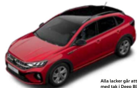
Alla lacker går att kombineras med tak i Deep Black Pearl | T