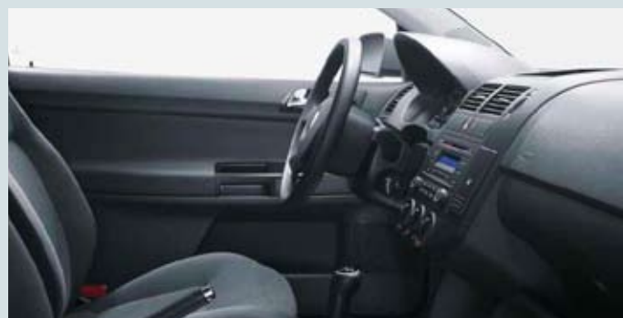
Förarmiljö Polo Comfortline med Masters-paket.