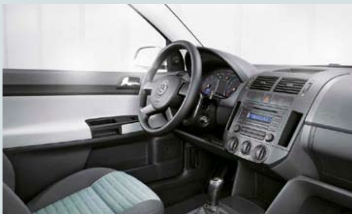
Förarmiljö Polo BlueMotion.