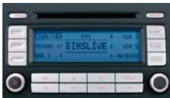
Radio RCD 300 med CD-spelare.