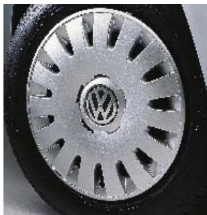
Stålfälg med hjulsida 6½ J x 16" med 215/55 R16-däck.