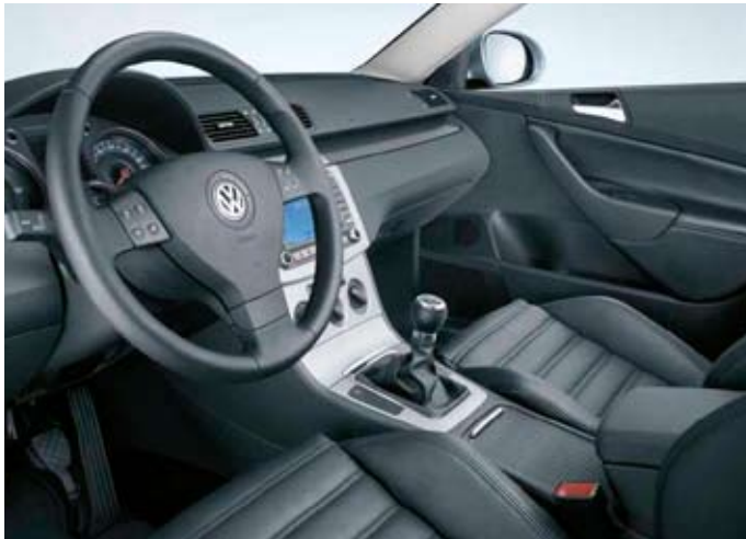
Förarmiljö Passat Sportline, med läderklädsel "Nappa" (tillval).

Tillval till alla modeller (ej TDI 105).