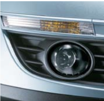
Dimstrålkastare, integrerade i stötfångaren.