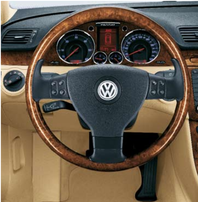
Multifunktionsrätt, 3-ekrad, i läder och valnöt.