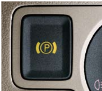
Parkeringsbroms, elektriskt manövrerad.