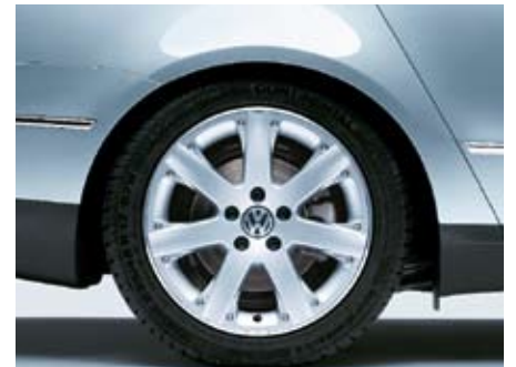
Lättmetallfälg "Westwood" 17".