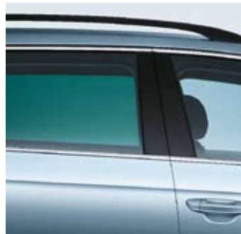
Sidorutor mörktonade (Businesspaket).