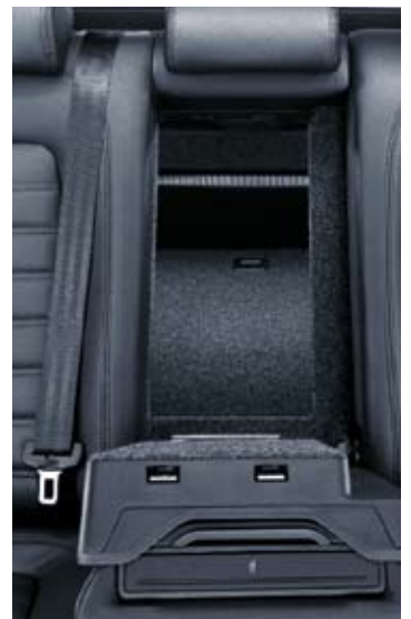
Genomlastningslucka i ryggstöd bak.