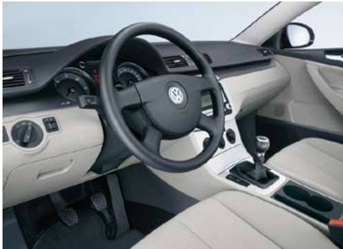
Förarmiljö Passat Trendline, med tygklädsel "Calino".

Standard alla modeller (ej 2,0 FSI Turbo, V6 4MOTION DSG).