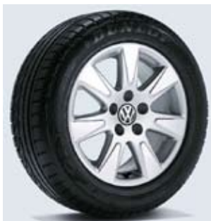
Lättmetallfälg "Catalunya" 7 J x 16" med 205/55 R16-däck.