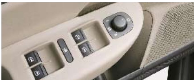
Elektriska fönsterhissar fram och bak.