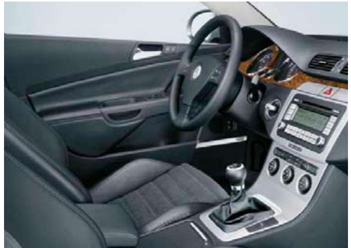
Förarmiljö Passat Highline, med läderklädsel "Nappa" (tillval).

Tillval till alla modeller (ej TDI 105).