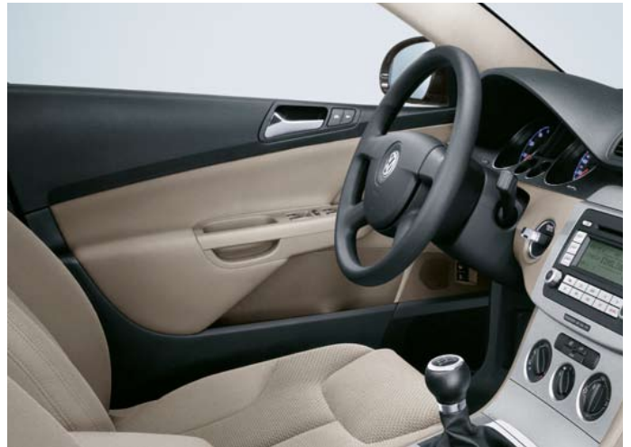
Förarmiljö Passat Comfortline, med tygklädsel "Verona".

Tillval till alla modeller (standard 2,0 FSI Turbo, V6 4MOTION DSG).