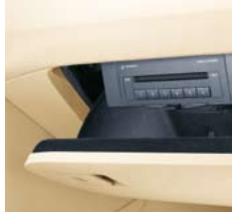
CD-växlare placerad i handsfacket.