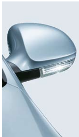
Ytterbackspeglar med integrerade blinkers.