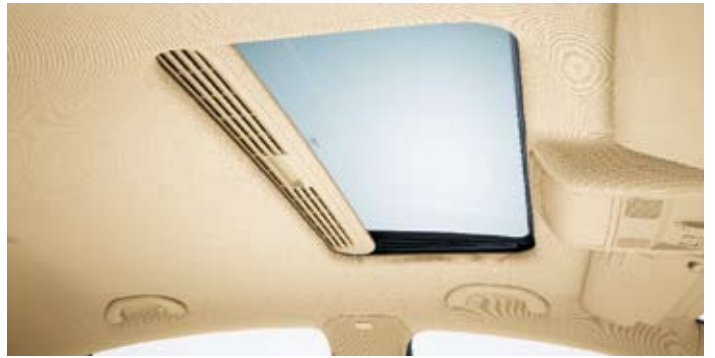
Elsollucka i glas.