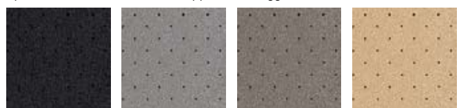
Black Classic Grey Latte Macchiato Pure Beige