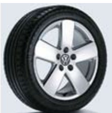
"Monte Carlo" 17"