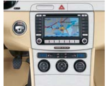
Navigationssystem. 2-zons klimatanläggning.