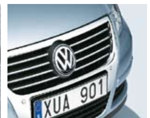
Kromade ribbor i grillen.