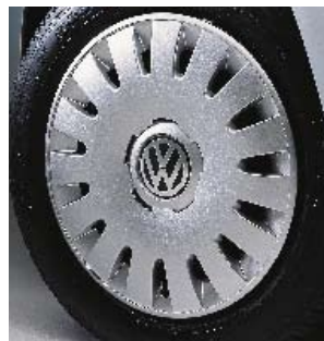
Stålfälg med hjulsida 6½ J x 16" med 215/55 R16-däck.