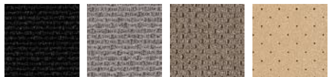
Black Classic Grey Latte Macchiato Pure Beige