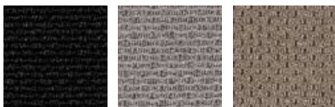
Black Classic Grey Latte Macchiato