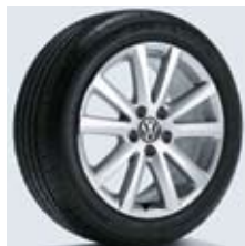
"Le Mans" 17"