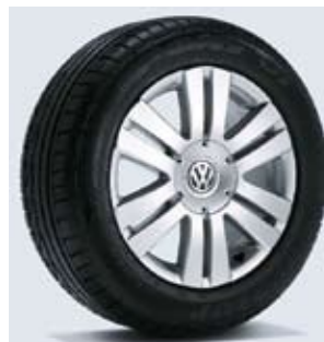
Lättmetallfälg "Adelaide" 7 J x 16" med 215/55 R16-däck.