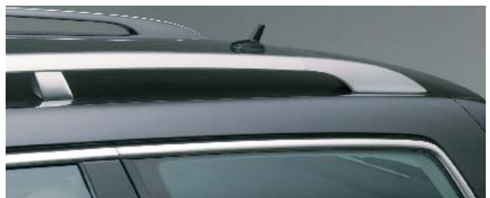
Kromad takreling (Variant).