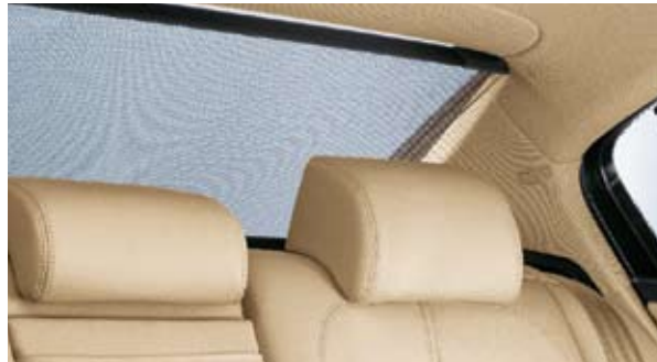
Elektrisk solskyddsgardin i bakrutan (Sedan).