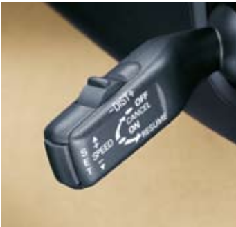
Farthållare med distansradar.