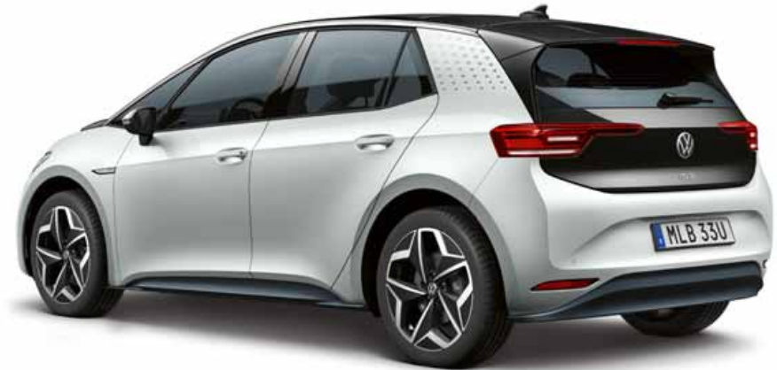
Scale Silver | T Metalliclack