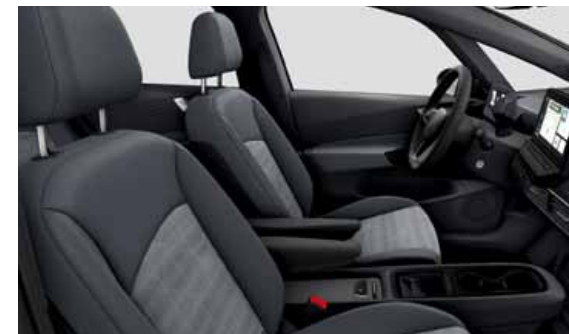
Tyglädsel Fragment | S Platinum Grey XX

ergoActive framstolar (elinställning på båda framstolarna och utdragbara lårstöd), finns som tillval.