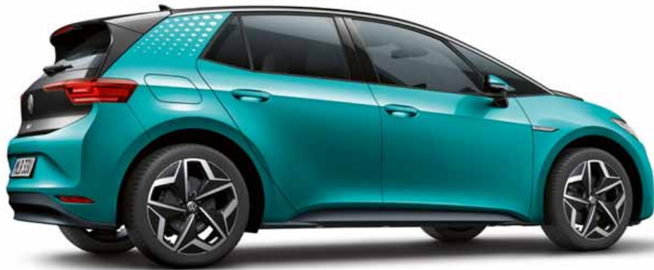
Makena Turquoise | T Metalliclack