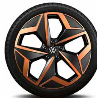
Andoya Penny Copper 19" | T*