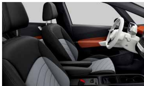
Art Velours | T Pro S (Style eller Style Plus interiör). Vit ratt och infotainment Dusty Grey Dark Safrano Orange XZ