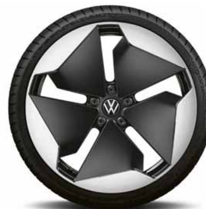
Sanya 20" | T*