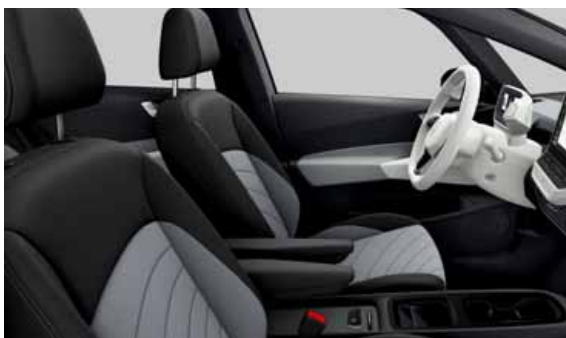
Art Velours | T Pro S Style eller Style Plus interiör. Vit ratt och infotainment Dusty Grey Dark SH