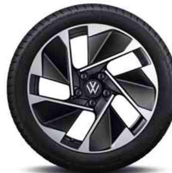
East Derry 18" | S