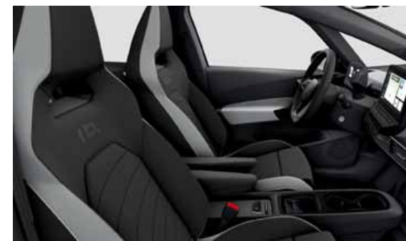
Tyglädsel med sittytor i Art Velours | T Top Sport Plus interiör. Svart ratt och infotainment Soul Black - Dusty Grey Dark - Ceramique/Soul Black LO