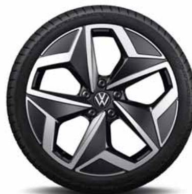
Andoya 19" | S Pro S T*