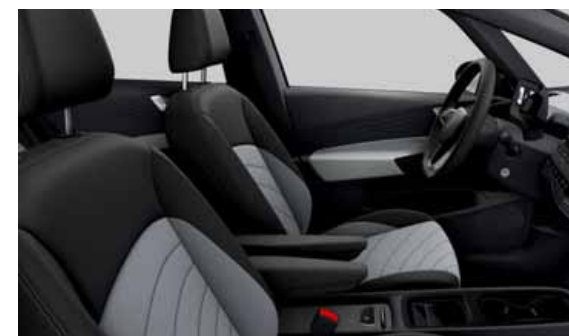
Tyglädsel Flow | S Pro S Style interiör Platinum Grey TN