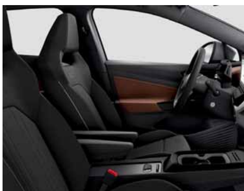
Klädsel Art Velours/Leatherette sidostöd, armstöd och dörrsidor