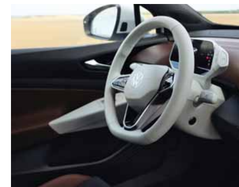
Med Stylepaket och Stylepaket Plus kan man välja vit ratt och vit infotainmentenhet. Ej till GTX.