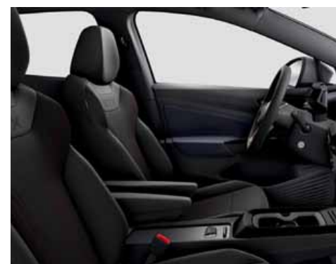
Klädsel Art Velours/Leatherette sidostöd, armstöd och dörrsidor