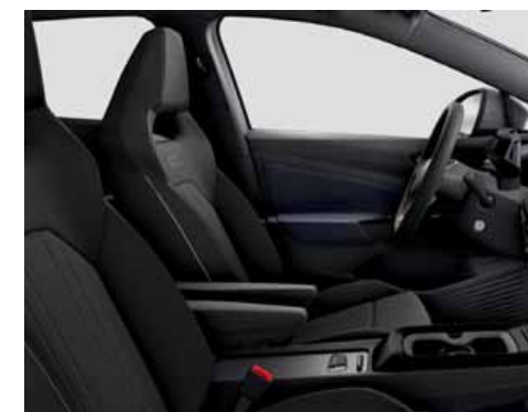
Klädsel Art Velours/Leatherette sidostöd, armstöd och dörrsidor