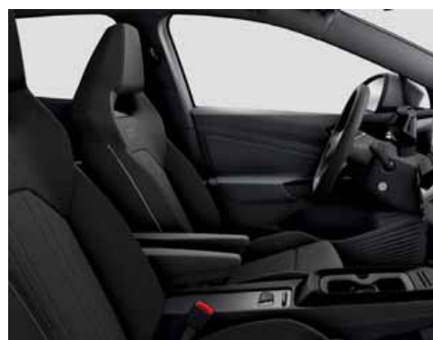
Klädsel Art Velours/Leatherette sidostöd, armstöd och dörrsidor