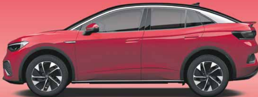
Kings Red | T Metallicklack