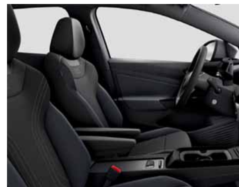
Klädsel Art Velours/Leatherette sidostöd, armstöd och dörrsidor