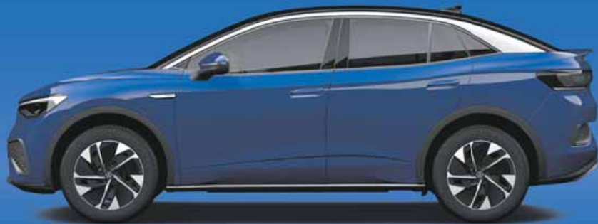
Blue Dusk | T 2 Metallicklack