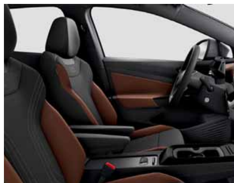
Klädsel Art Velours/Leatherette sidostöd, armstöd och dörrsidor