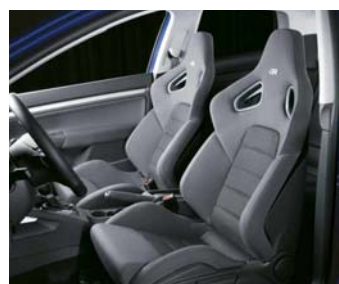
Sportstolar "Recaro" finns som tillval med läderklädsel.