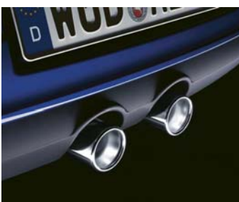
R32 har dubbla synliga kromade slutrör som standard.