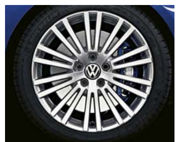
Lättmetallfälg "Zolder" 7½ J x 18" är standard.