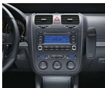
Radio RCD 300 med 10 st högtalare är standard.