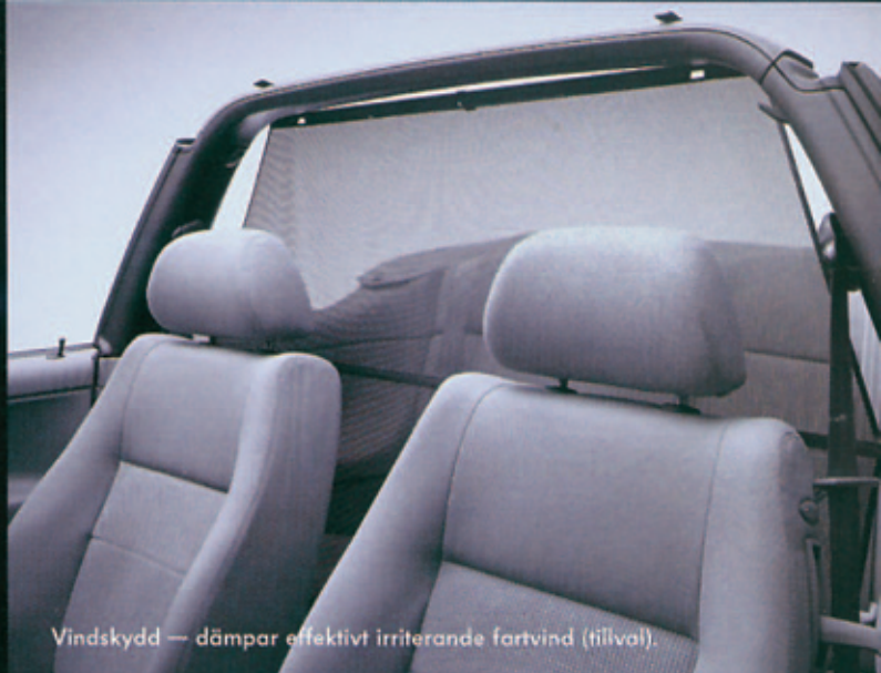
Vindskydd — dämpar effektivt irriterande fartvind (tillval).