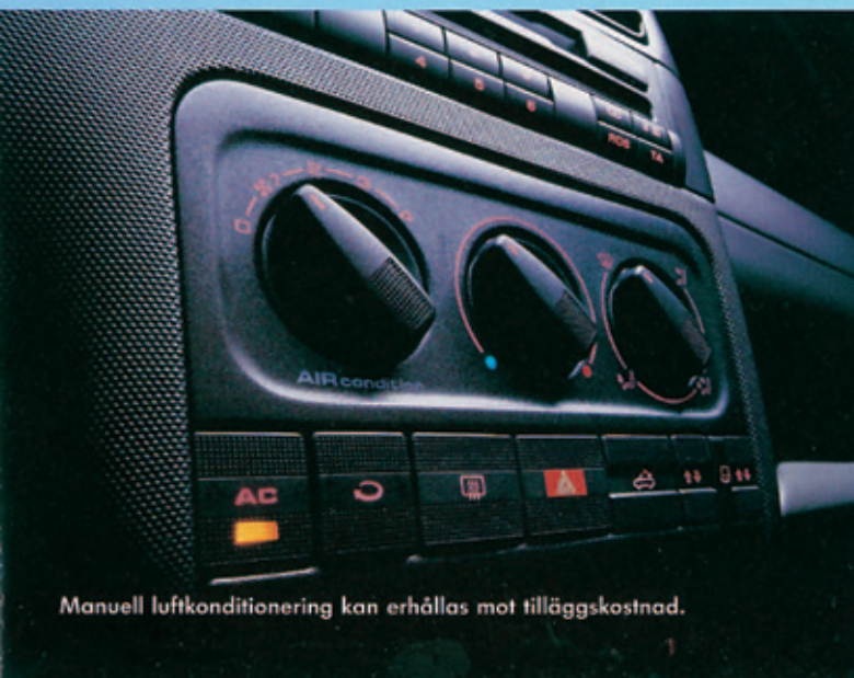
Manuell luftkonditionering kan erhållas mot tilläggskostnad.