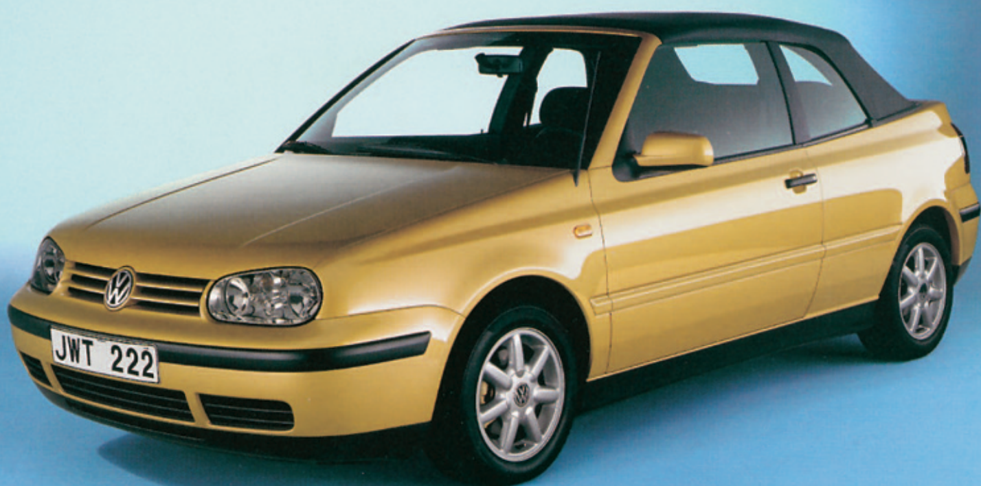
Nya Golf Cabriolet erbjuder en alldeles särskild känsla. Det är en frihetsupplevelse att åka öppet. Hos Golf Cabriolet är det särskilt angenämt — suffletten fälls bekvämt upp och ner med elektronikens hjälp. (Fälgarna på bilden erbjuds ej i Sverige.)