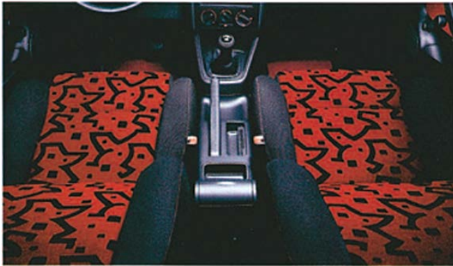
Sportstolar med tygklädsel