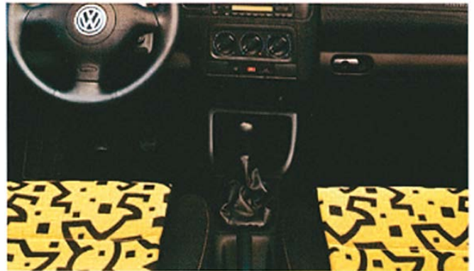
Inredning Trendline med sportstolar och lädersportrott är standard på Golf Cabriolet