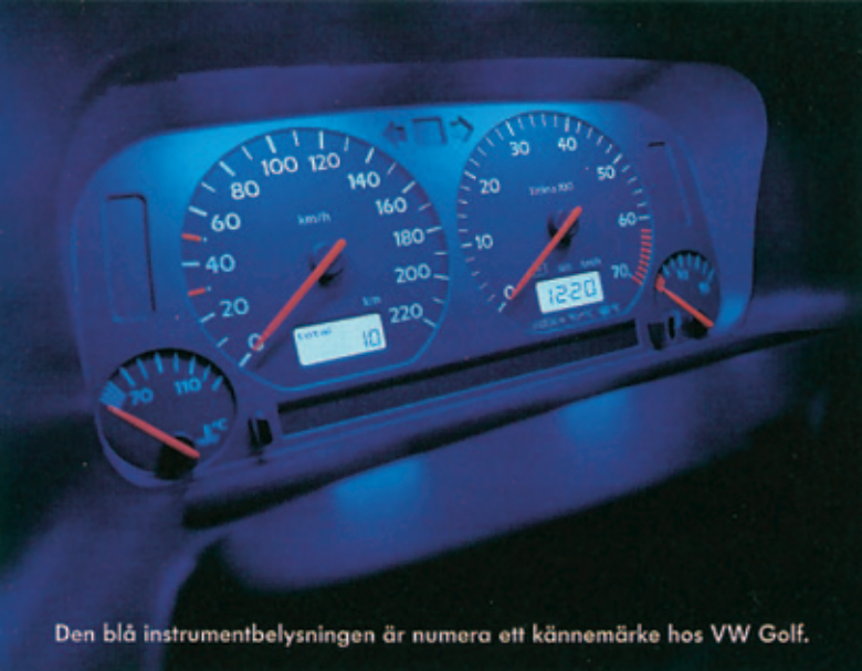
Den blå instrumentbelysningen är numera ett kännemärke hos VW Golf.